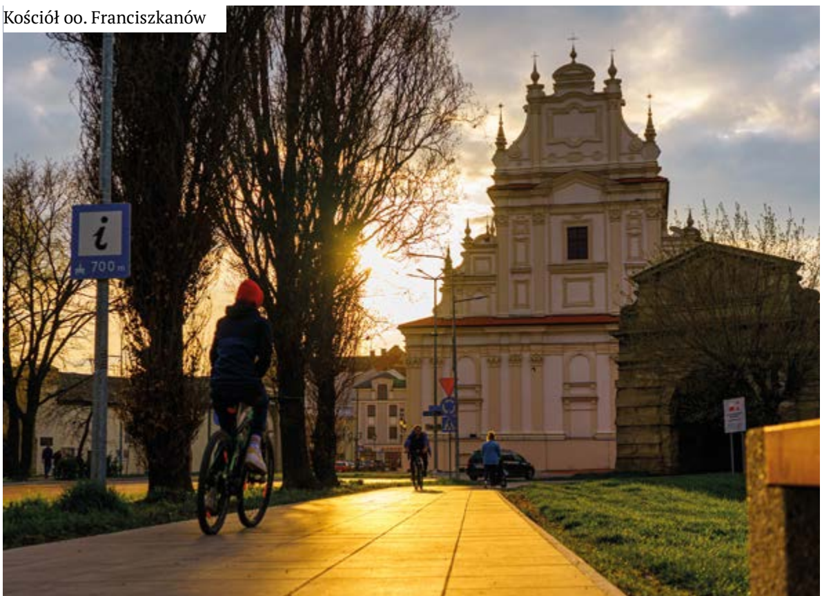
Kościół oo. Franciszkanów